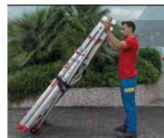
Kompaktowa, lekka i łatwa do złożenia. Compact size for easy transportation.