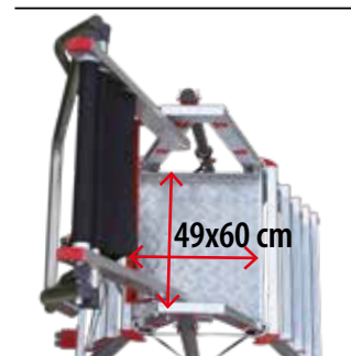
Bezpieczna platforma robocza. Non-slip working platform.