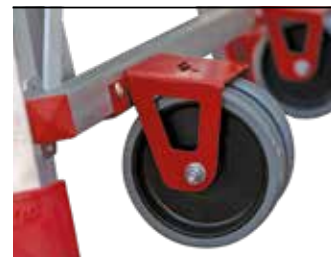
Absolutna stabilność podczas pracy, wygodne i szybkie przemieszczanie. Absolute stability while working and easy to move.