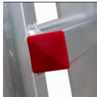
Zaślepka do stopnia PLS. Cap for step for PLS.