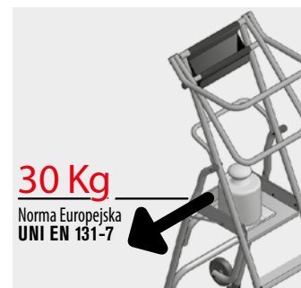
30 Kg Norma Europejska UNI EN 131-7