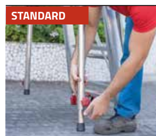
STANDARD Stabilizator teleskopowy. Telescopic stabilizer.