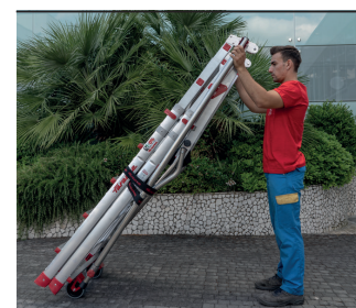
Kompaktowa, lekka i łatwa do złożenia. Compact size for easy transportation.