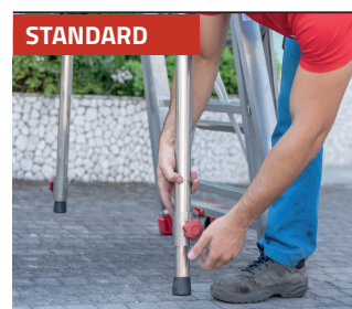
STANDARD Stabilizator teleskopowy. Telescopic stabilizer.