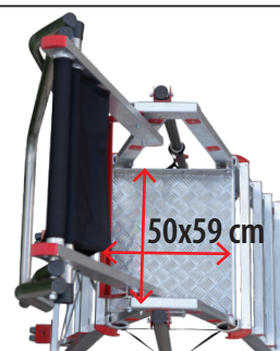
Bezpieczna platforma robocza. Non-slip working platform.