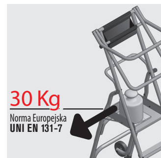
30 Kg Norma Europejska UNI EN 131-7