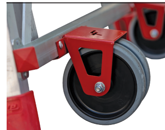
Absolutna stabilność podczas pracy, wygodne i szybkie przemieszczanie. Absolute stability while working and easy to move.