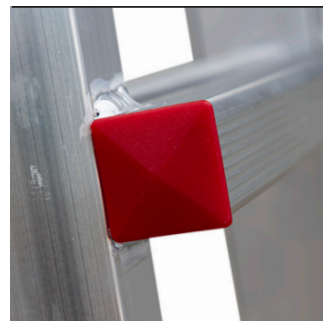
Zaślepka do stopnia PLS. Cap for step for PLS.