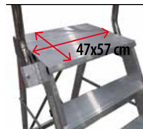
Powiększony podest - L. Enlarged platform - L.