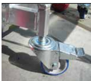
Kółka - R. Wheels - R.