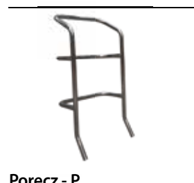
Poręcz - P. Handrail - P. Poręcz (BRAC.CM) pasuje tylko do modeli CM z P w Kodzie produktu. Handrail (BRAC.CM) only for CM models with P in Product Code.

Mocne, proste w użyciu i bezpieczne, ze stopniami 15 cm. Wygodne wchodzenie przy nachyleniu 60°. Szeroki górny podest 57x31 cm lub 57x47 cm i szybki system składania.