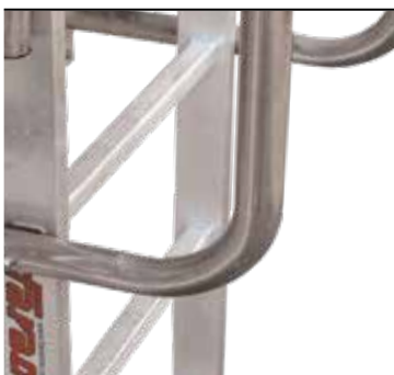
Poręcze do bezpiecznego wspinania się. Handrails for more comfort and safety.

MOŻLIWOŚĆ ZAKUPU Z REGULACJĄ I BEZ REGULACJI KOTEW. POSSIBILITY TO PURCHASE WITH AND WITHOUT REGULATION.