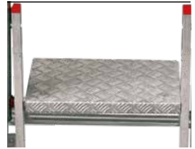
Skrajna blacha, regulowana. End sheet metal.

INFORMACJE WYMAGANE PRZEZ LD. 81 ART. XX SĄ DOSTĘPNE NA KAŻDYM PRODUKCIE THE INFORMATION REQUESTED BY LD. 81 ART. XX ARE AVAILABLE ON EACH PRODUCT