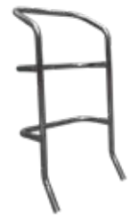
Poręcz - P. Handrail - P. Poręcz (BRAC.CM) pasuje tylko do modeli CM z P w Kodzie produktu. Handrail (BRAC.CM) only for CM models with P in Product Code.

Mocne, proste w użyciu i bezpieczne, ze stopniami 15 cm. Wygodne wchodzenie przy nachyleniu 60°. Szeroki górny podest 57x31 cm lub 57x47 cm i szybki system składania.