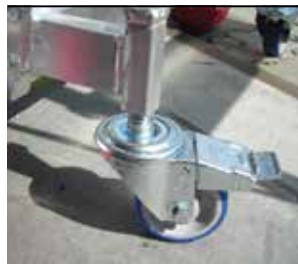
Kółka - R. Wheels - R.