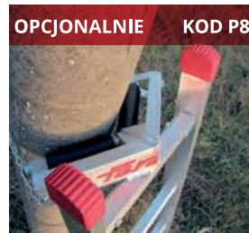
OPCJONALNIE KOD P8 Opcjonalne zabezpieczenie Optional pole support