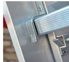
Specjalny element zabezpieczający przed rozłączeniem. Special unhook safety device