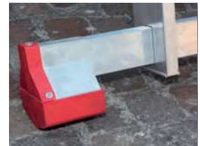
Nowa podstawa stabilizująca New stabilizer base.