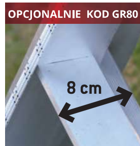
OPCJONALNIE KOD GR80 Stopnie o szerokości 8 cm 8 cm wide rungs